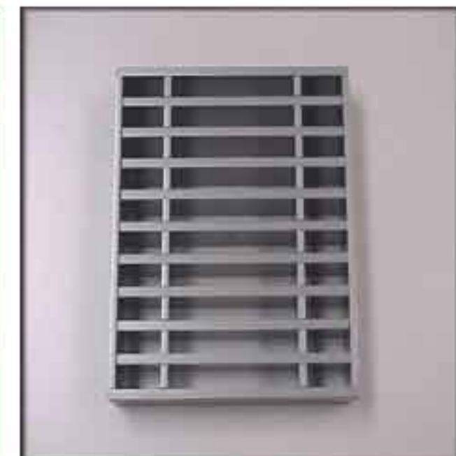
REJILLAS INTUMESCENTES: Resistencia: RF 120